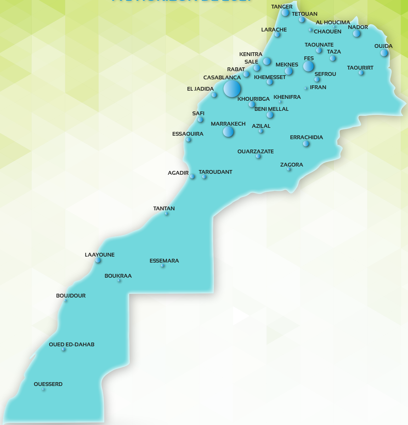
Potentiel d'EE en Climatisation (MWh/an) à l'horizon de 2021