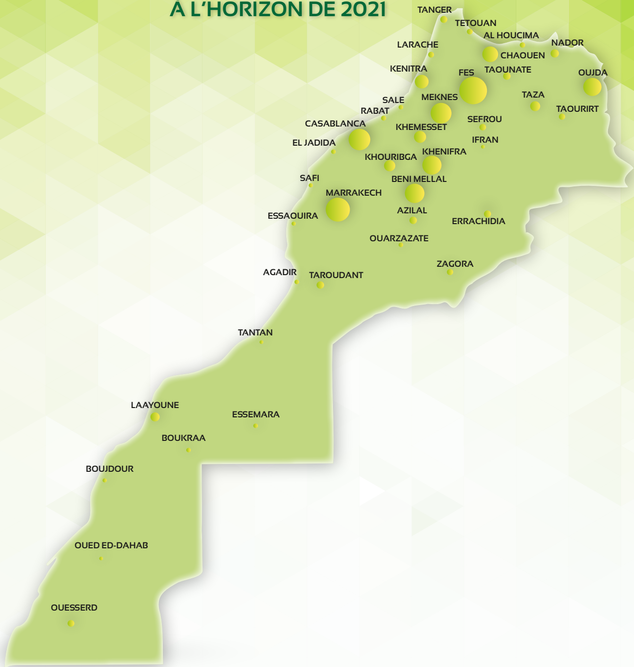
Potentiel d'EE en Chauffage et Climatisation (MWh/an) à l'horizon de 2021